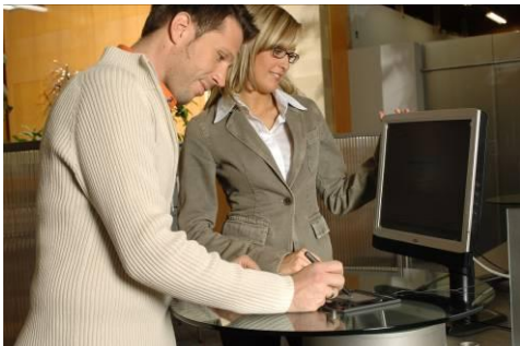
Signature-Pad via USB mit PC verbunden